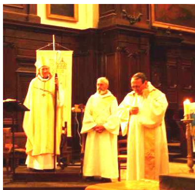
La célébration du dimanche