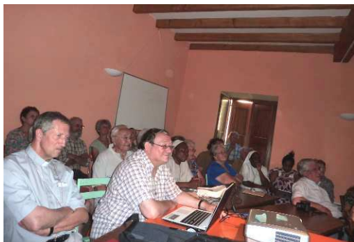
A la découverte du Burkina-Faso